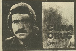
EMEKÇİ GEREK, SAVAKLARIN BUĞUN KAVGA GÖNDÜR...